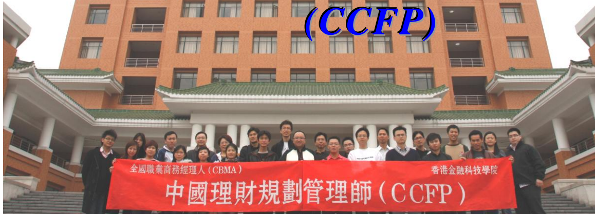
CCFP 學員攝於華南理工大學

China Certified Financial Planner (CCFP)